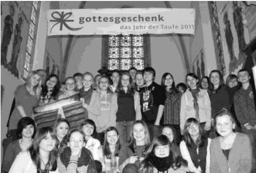
Die Konfis 2011 beim Vorstellungsgottesdienst