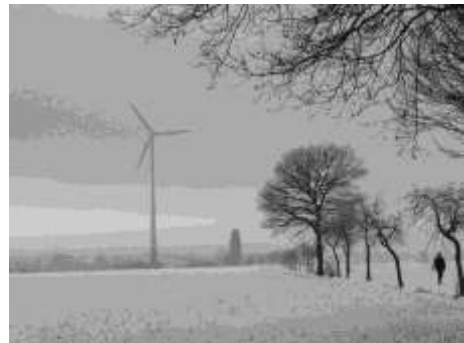
Windrad am Spreitweg

In der Reihe „Aus den Quellen schöpfen“ wird ein biblisches Thema an einem dafür passenden Ort bedacht. Die nützliche, aber auch ambivalente Energie des Windes soll in unmittelbarer Nähe eines Windkrafttrades anschaulich werden. Zwischen Schöpfungsgeschenk und Bedrohung schillert die Rede vom Wind in der Bibel - und nicht zu vergessen ist die Verbindung von Windeswehen und Heiligem Geist. Ein spannendes Thema.