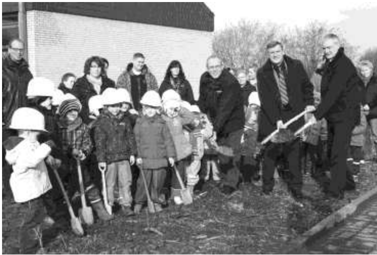
Erster Spatenstich der Kinder und weiterer Personen ...

und Steine, ein Kran wurde aufgebaut und Mischfahrzeuge brachten Beton. Das tolle ist, das wir das alles jederzeit vom Fenster aus beobachten können. Dabei haben wir viel Neues gelernt, ebenso auch aus Bilderbüchern zum Thema „Bauen“. So spielen wir jetzt oft „Baustelle“, bauen Kräne und LKWs und transportieren Steine und Sand.