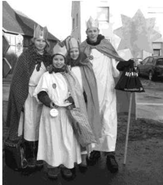
Unterwegs im Auftrag der katholischen Pfarrgemeinde: Vier evangelische Jugendliche