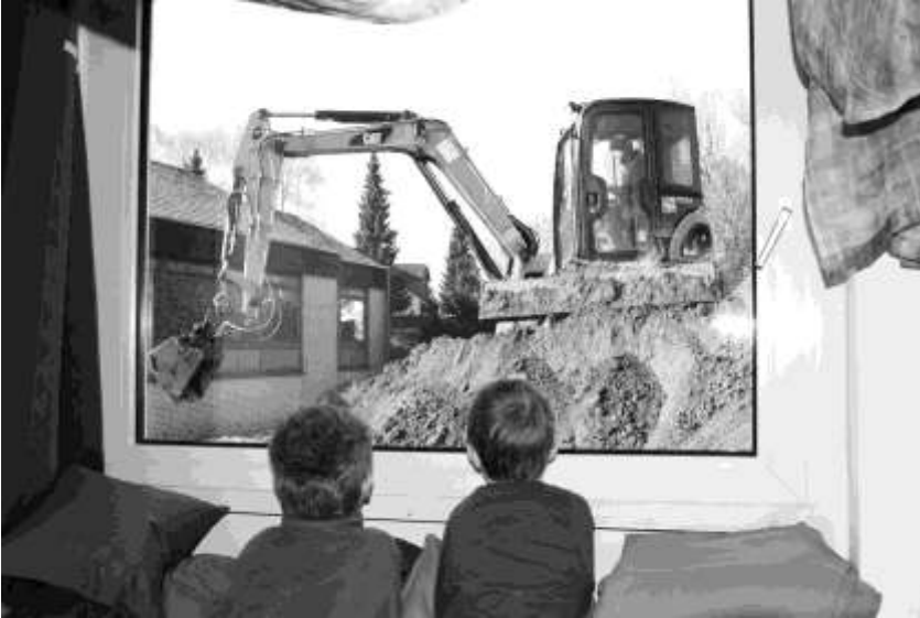
Was für ein Ries fernseher ...

Wir, die Kinder der Kita Am Rennweg, wollen euch mal erzählen, was bei uns in letzter Zeit alles los ist. Angefangen hat es nebenan mit Krach im Gemeindehaus - die Erwachsenen nennen das „Entkernungsarbeiten“. Viel gesehen haben wir da noch nicht, außer einer Menge Bauschutt, der in Containern abtransportiert wurde. Aber dann ging's richtig los: Als wir am Montagmorgen, den 7. Februar zur Kita gebracht wurden, trauten wir unseren Augen nicht. Alles sah plötzlich anders aus. Alle Bäume und Sträucher zwischen Gemeindehaus und Kita waren gerodet worden!